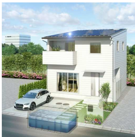
図1 「OTSハウス」イメージ

近年の日常生活を脅かす災害の多発により、水や電気などのライフラインに対する意識が大きく変化中、また新型コロナウイルス等の疫病の発生など複合的災害の危険に直面している現代社会において、災害発生時も平常時と同じ生活が送れる「OTSハウス」はこれからの時代に適応した住宅と言えます。