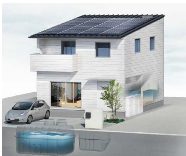
図I 「OTSハウス」イメージ

近年の日常生活を脅かす災害の多発により、水や電気などのライフラインに対する意識が大きく変化する中、また新型コロナウイルス等の疫病の発生など複合的災害の危険に直面している現代社会において、災害発生時も平常時と同じ生活が送れる「OTSハウス」はこれからの時代に適応した住宅と言えます。